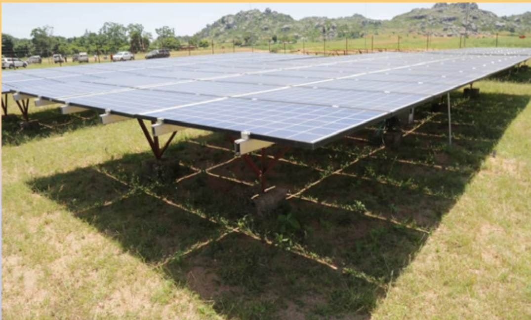
Muonekano wa baadhi ya mitambo ya umeme jua inayomilikiwa na kampuni ya JUMEME, iliyopo Kisiwa cha Ukara- Ukerewe.

Katika ziara hiyo Naibu Waziri alifuatana na wataalam kutoka EWURA, TANESCO, REA na wizara ya Nishati.