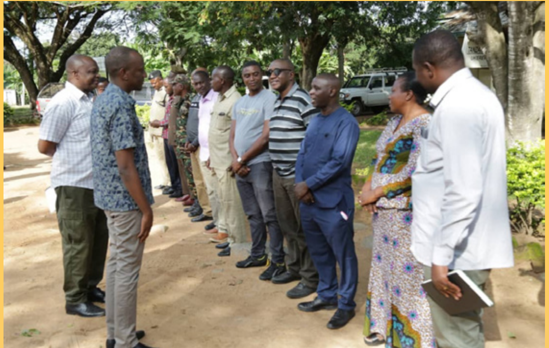
Naibu Waziri wa Nishati, Wakili Stephen Byabato akisalimiana na kamati ya Ulinzi na Usalama ya Wilaya Ukerewe.

Ziara hiyo imefanyika Februari 27, 2022 ambapo alikutana na wajumbe wa Kamati ya Ulinzi na Usalama Wilaya ya Ukerewe na kupokea taarifa ya upatikanaji wa umeme katika wilaya