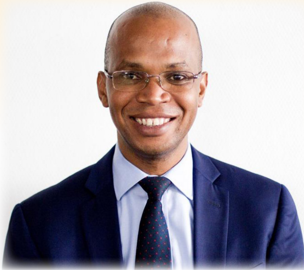
Waziri wa Nishati, January Makamba