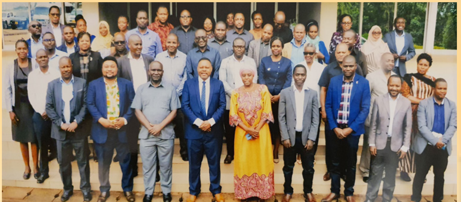
Wajumbe wa Mkutano wa baraza la Wafanyakazi wa Wizara ya Nishati wakiwa katika picha ya pamoja wakati wa semina fupi kuhusu VVU, UVIKO na Magonjwa sugu yasiyoambikizwa iliyotolewa kwa Wajumbe wa Baraza la Wafanyakazi wa Wizara ya Nishati katika mkutano uliofanyika mkoani Morogoro tarehe 07 na 08 Mwezi Februari, 2022

maambukizi mapya ya Virusi vya Ukimwi pamoja na Elimu ya ujasiriamali .